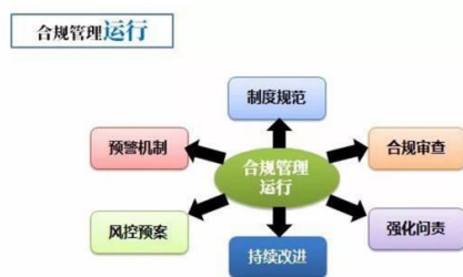
图 3. 科学管理机制

进而使得图书管理人员能够尽心尽力的做好管理工作，且对图书馆的发展起到正能量的积极作用。