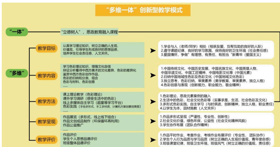
图1. 建设前期“多维一体”创新型教学模式结构图

图1为2021年项目立项时，围绕《设计色彩》课程创建的前期“多维一体”创新型教学模式结构